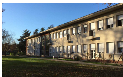
Plesso G. Carducci

La scuola primaria accompagna gli alunni all'elaborazione del senso della propria esperienza, mira all'acquisizione degli apprendimenti di base ed offre agli allievi l'opportunità di sviluppare le dimensioni cognitive, emotive, affettive, sociali, corporee, etiche e religiose. È scuola formativa attraverso gli alfabeti delle discipline il cui compito peculiare è quello di porre le basi per l'esercizio della cittadinanza attiva, potenziando e ampliando gli apprendimenti promossi dalla scuola dell'infanzia.